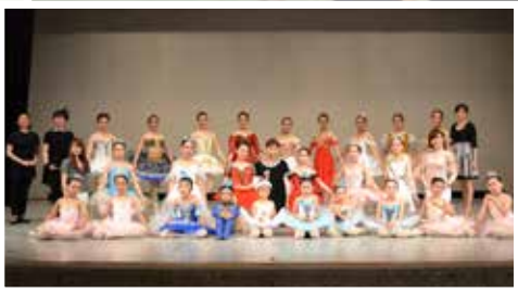
◀発表会後の集合写真

見学・体験レッスン随時受付中 子どもの情操教育の一環として、クラシックバレエの基礎から指導します。美容や健康にいい大人のクラスもあります。 問い合わせ 小浜研究所☎080-8695-3878