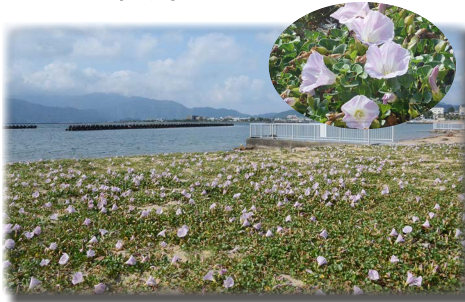
夏には海水浴客でにぎわう人魚の浜海岸の一隅で、薄紅色の花の群れが心地よい初夏の風に吹かれていました(6月7日撮影)