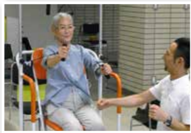
健康器具を体験する地区の皆さん