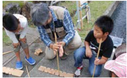
▲自然エネルギーを学ぼう(同事業)