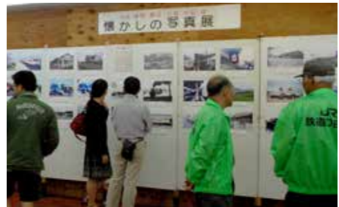
▲小浜線開業90周年記念事業(同事業)

【対象の事業】 市民と市が協働で取り組む、地域の課題解決につながる事業(年度内に終了すること)