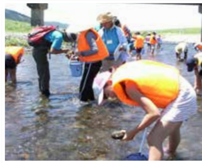
北川で調査を行う子どもたち

美しい自然を感じて 北川水系水生生物調査 小浜城址が残るかつての城下町・雲浜地区。まちづくり委員会を中心に、郷土の偉人や一級河川・北川などの地域資源を生かしたまちづくりを行っています。