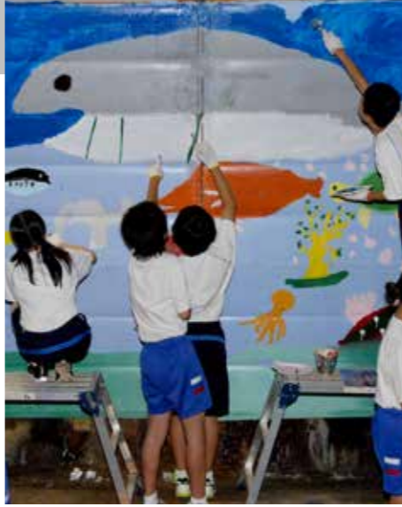
▶海夢トンネル壁画制作(24年度採択事業)

市では、ふるさと納税を活用して、市民の自主的なまちづくり活動を促進し、協働によるまちづくりを進めるため、平成21年度から「いいとこ小浜づくり活動支援事業」に取り組んできました。このたび、より協働を推進するため、事業の見直しを行い、事業名を「いいとこ小浜づくり協働推進事業」として、提案を募集します。