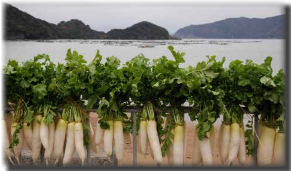
犬熊区の海岸通りに吊るされたダイコン。日光と寒風に干すことで味が良くなる。その向こうには養殖イカダが浮かぶ(12月5日撮影)