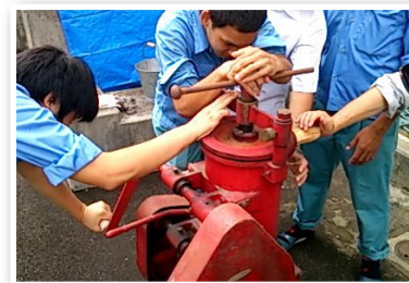
アブラギリから油の採取に挑戦

種から塗料などに用いる油が採取できるアブラギリ。かつて、産地であった上根来地区で、これを活用して、地区再生の起爆剤にしようと、県の新しい公共の場づくりモデル事業として、WACにおさまが、若狭東高校や観光局などと連携して取り組んでいます。