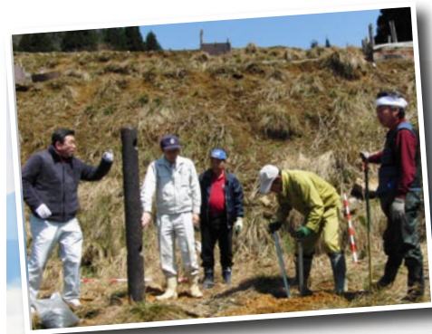
登山道案内看板の設置(上)、おにゅう峠から高島方面の雲海を望む(下)