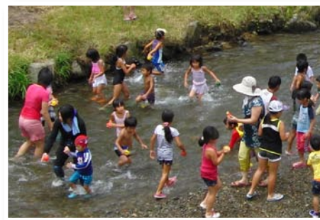
子どもたちで賑わう魚つかみ大会

美しい山々に囲まれ、お水送りが行われる遠敷川が流れる遠敷地区。ふるさとづくり推進会を中心に、住民、団体、行政が連携したまちづくりが進められています。