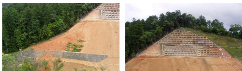
※亀裂が入った道路沿いの擁壁（高さ 7m 以上）が崩壊しないよう、擁壁を押さえるために、道路上に盛土をして施工しています