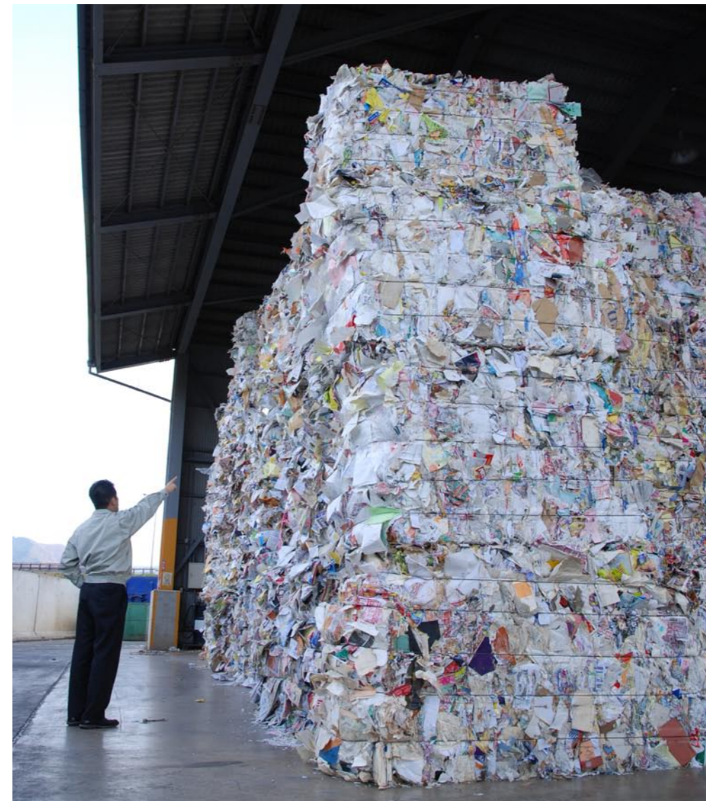
収集された「その他紙」。機械で圧縮され、高く積み上げられて一時保管されます