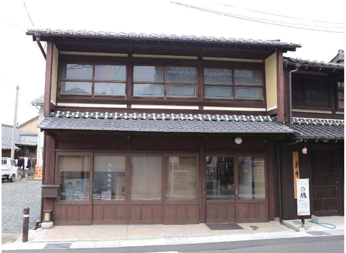
高鳥家住宅 (平成26年度 修理)