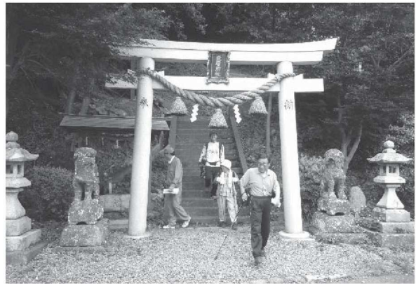
後瀬山登山 愛宕神社登山口