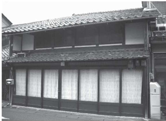
3 5 (修理前)