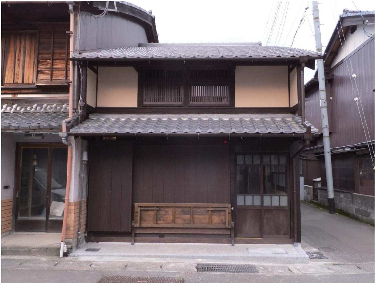
横山家住宅 (平成25年度 修理)