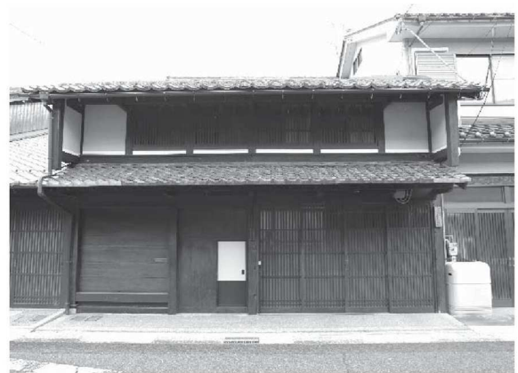
3 5 (修理後)