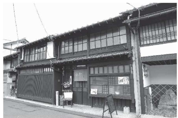
1 8 7 ・ 1 8 6 (修理後)