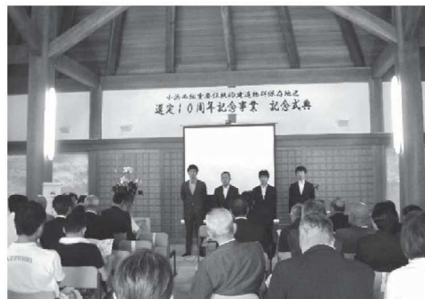
マスタープラン発表