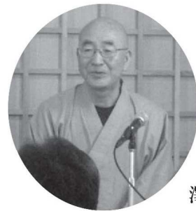
澤口協議会長(当時)