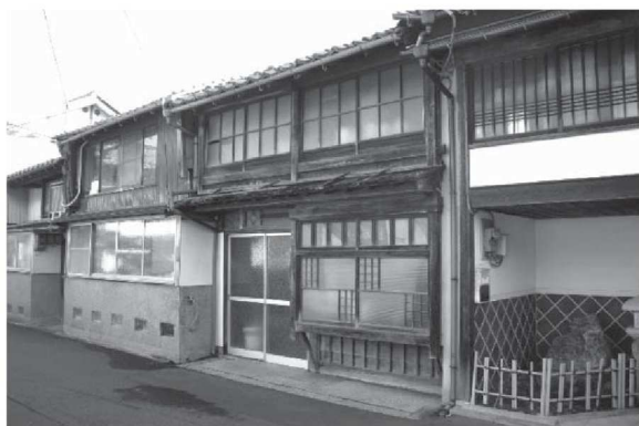
1 8 7 ・ 1 8 6 (修理前)